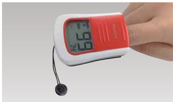
パルスオキシメーター ※脈拍数と動脈血中酸素飽和度を自動測定