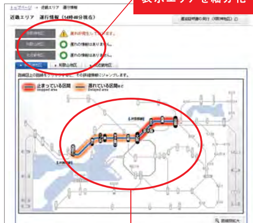
表示エリアを細分化