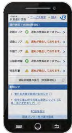
スマートフォン 対応します。