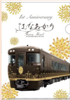
表面 / Front / 正面