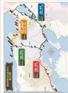
裏面 / Back / 反面