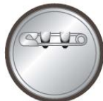
裏面 Back / 反面