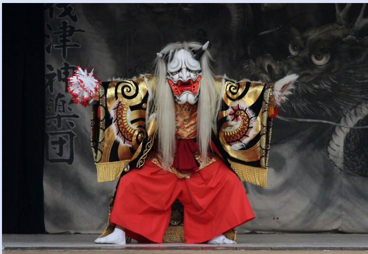
©히로시마 가구라 정기 공연

여행 속에서 지역 문화의 깊은 정취를 접하며 전통 예능의 강렬한 에너지와 아름다움을 가까이에서 느끼실 수 있습니다.