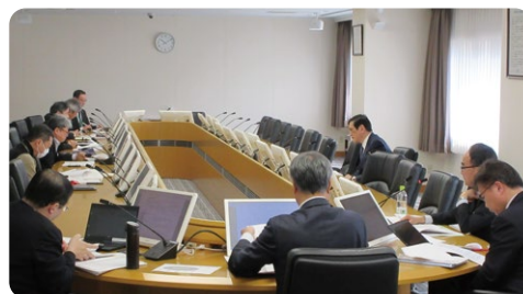
安全マネジメントレビュー会議の開催