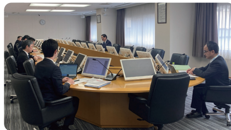
安全マネジメントレビュー会議の開催