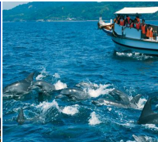
天草 イルカウォッチング