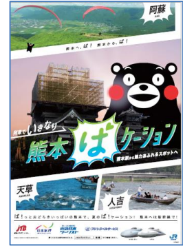
B1ポスター ビジュアルイメージ

熊本城に寄り添う「くまモン」のほっぺは、上る朝日になぞらえてデザインすることで、復興感をよりイメージできるデザインとしています。