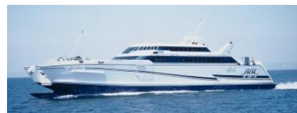
熊本フェリー オーシャンアロー