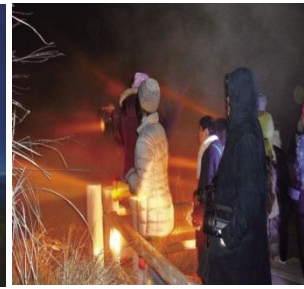
雲仙地獄 ナイトツアー