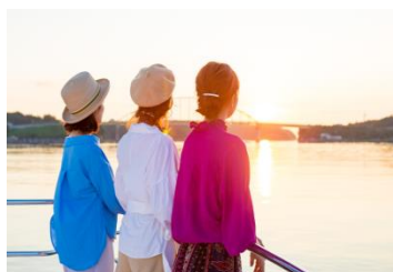
プレミアムサンセットクルーズ