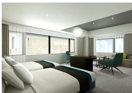
ヴィスキオツイン