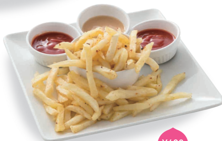
鬼盛りポテトフライ ¥600 (税込)

お好みに合わせて3種類のソースをつけてお楽しみください。 ①ピリ辛の「鬼ソース」 ②スタンダードの「トマトソース」 ③甘口の「桃ソース」