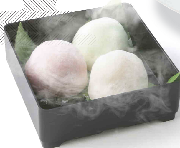
あけてビックリ!宝箱 ¥800 (税込) シャーベット&アイスセット

白桃とマスカットぶどうのシャーベット、バニラアイスを求肥で包んだセットです。宝箱を開けるとヒヤリとした不思議な煙が飛び出します。(おじいさんにはなりませんのでご安心ください。) 西日本調理師製菓専門学校 監修 製菓科専任教員: 玉田 浩二郎 / 生徒: 野本 果鈴