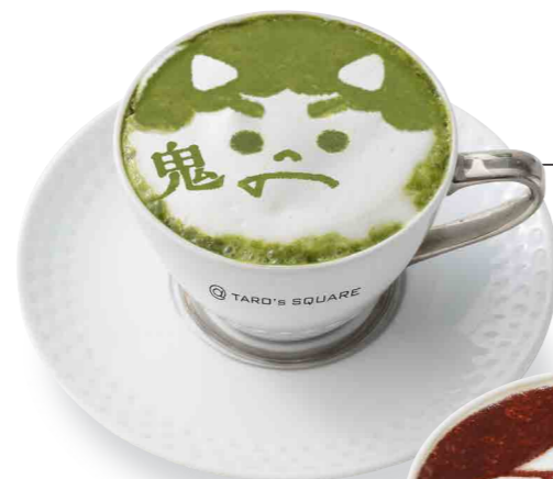
TARO'S ラテ ¥550 (税込) (ココア or 抹茶)

ラテアートのデザインを桃太郎にちなんだ6種類(桃太郎、犬、猿、雉、鬼、鬼ヶ島)からお選びください。