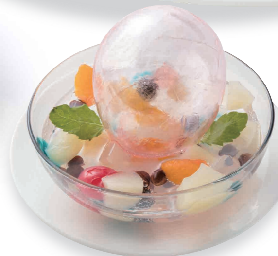
Don・Burako ¥800 (税込)

白桃とマスカットぶどうのシャーベット、バニラアイスを求肥で包んだセットです。宝箱を開けるとヒヤリとした不思議な煙が飛び出します。(おじいさんにはなりませんのでご安心ください。) 西日本調理師製菓専門学校 監修 製菓科専任教員: 玉田 浩二郎 / 生徒: 野本 果鈴