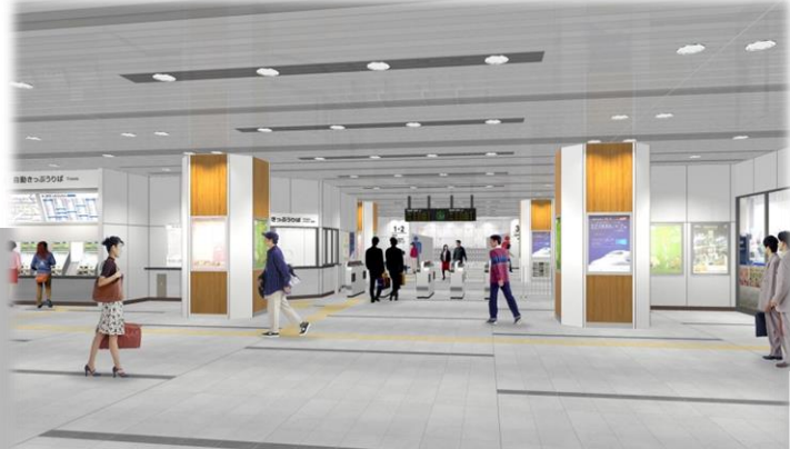
東口と西口が通り抜けできるようになります。