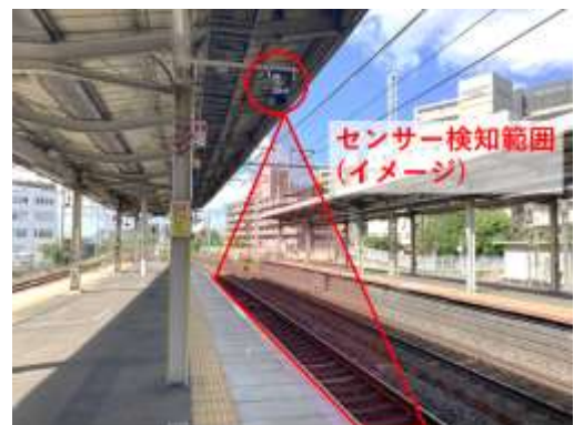
（写真は茨木駅2番のりば）