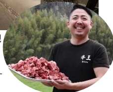
▶BBQ パーティー (イメージ)