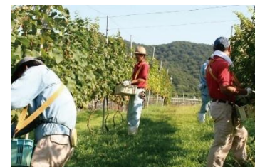
▲飛鳥ワインぶどう畑

農薬や除草剤にはできるだけ頼らない循環型農業でぶどうを育てる等、栽培からワインづくりまで品質へのこだわりが自慢のワイナリー。ぶどう栽培や醸造過程等、飛鳥ワインのこだわりを聞き、フラッグシップワインを5種類テイスティングできるランチ付きツアーも。