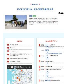
▲モデルコース（イメージ）

大阪市・堺市・北摂・河内・泉州の各エリアのおすすめ特集や、「国宝めぐり」などテーマに沿った特集をご紹介します。