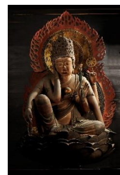
▲ 国宝 木造如意輪観音坐像（観心寺）