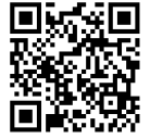
大阪アフターDC 特設サイト

大阪アフターDC のための特別な企画の一部をご紹介します。掲載している企画以外にも多数の企画をご用意し、皆さまのお越しをお待ちしております。料金や開催期間等詳細は『大阪デスティネーションキャンペーンアフターキャンペーン』公式 WEB サイトをご覧ください。