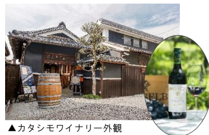
▲カタシモワイナリー外観

100 年前、日本一のぶどう産地だった大阪。その歴史を今に伝える、現存する西日本最古のワイナリー。駅から徒歩で訪れることができ、登録有形文化財の蔵見学や試飲が付いたツアーも充実。風情溢れる古民家やぶどう畑、大阪ワインの伝統と現在を体感できる。