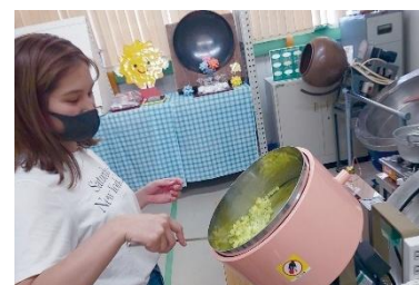
▲コンペイトウ作り体験（イメージ）

世界で親しまれるコンペイトウの歴史と製造を学び、色と味を選んでオリジナル作りを体験。DC 特別体験では紅しょうが味と好みの味を組み合わせた2色2味に、たこ焼きシャカシャカフレーバーを添える限定プランも。