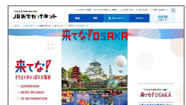
▲大阪アフターDC 特設サイト（イメージ）