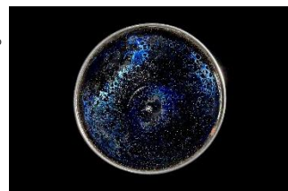
▲ 国宝 曜変天目茶碗（藤田美術館）