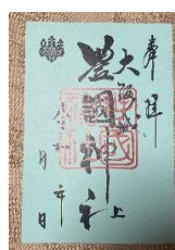
▲豊國神社特別御朱印 (イメージ)

1931年に復興された3代目天守閣を有する「大阪城」を訪問。2025年4月開館の「大阪城 豊臣石垣館」など、城内を大阪城天守閣館長の解説とともに巡ります。また、二の丸南に鎮座し豊臣秀吉公を祀る「豊國神社」では御神楽奉納を鑑賞するなど、大阪城の深い歴史や伝統を堪能します。