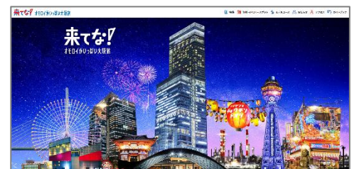
▲「来てな！オモロイがいっぱい大阪旅」公式サイト