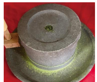
▲石臼での抹茶体験イメージ

安政元（1854）年創業の「西尾茗香園茶舗」で、石臼で抹茶づくり体験し、挽いた抹茶をご自身で点てて召し上がっていただけます。最後には煎茶の美味しい淹れ方のレクチャーもあり、期間限定で抹茶チョコをプレゼントします。