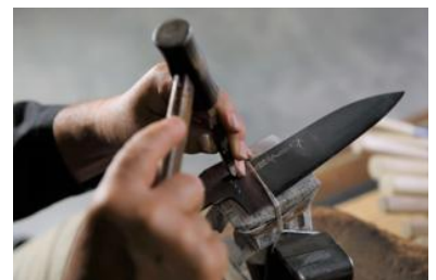
▲名入れ風景（イメージ）

創業 221 年の歴史で培われた堺刀司の職人によるレクチャーで、長く愛用できるマイ庖丁を作る体験です。