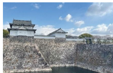
▲多聞櫓・千貫櫓外観

大阪城では、「大阪城櫓 YAGURA 特別公開 2026」と題して、重要文化財である多聞櫓・千貫櫓・乾櫓の内部を特別に公開します。数々の災禍をくぐり抜けて今日まで残った貴重な「櫓」の内部を是非ご覧ください。