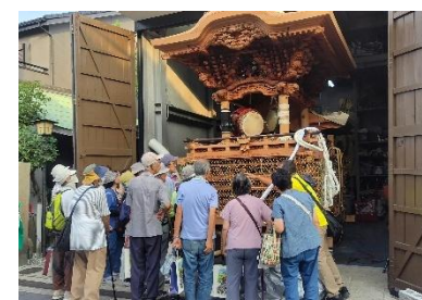
▲だんじり小屋めぐり（昨年の様子）

岸和田市内のだんじりが格納されているだんじり小屋を中心に、だんじりや歴史スポットをめぐる通常では味わえないウォークツアー。豊臣ゆかりの彫物をめぐるコースもご用意します！