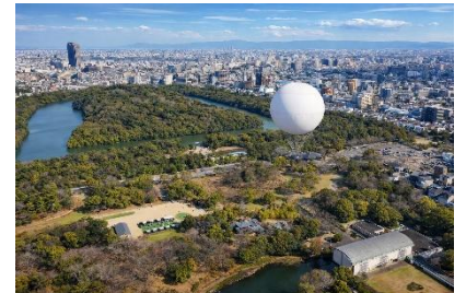
▲おおさか堺バルーンと仁徳天皇陵古墳

上空約 100m から仁徳天皇陵古墳をはじめとした世界遺産・百舌鳥古墳群や堺の街並みを眺望し、歴史的な価値や雄大さ等の魅力を体感してください。都市部における日本唯一のヘリウム型気球から 360 度の眺望を楽しんでいただけます。