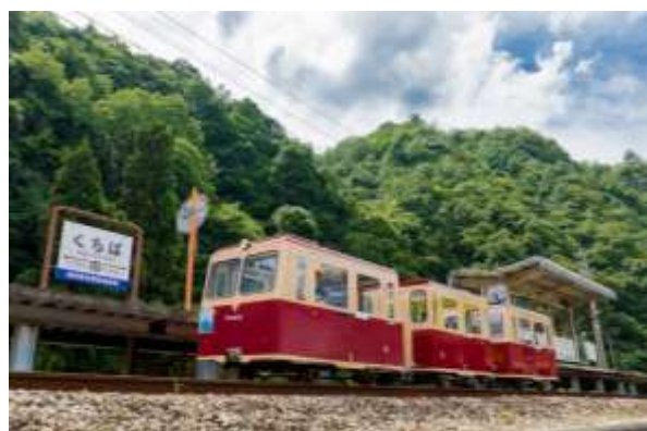
邑南町三江線鉄道公園 口羽駅公園（旧 JR 三江線口羽駅）