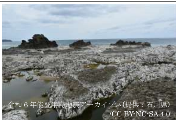
令和 6 年能登半島地震アーカイブス(提供：石川県) /CC BY-NC-SA 4.0