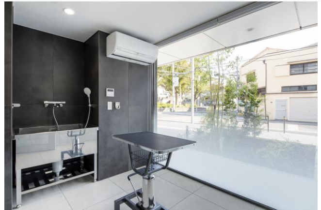
【トリミングルーム】