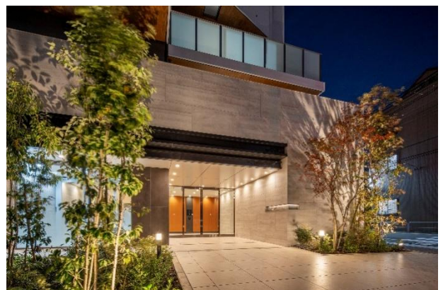
【エントランス周り夜景】