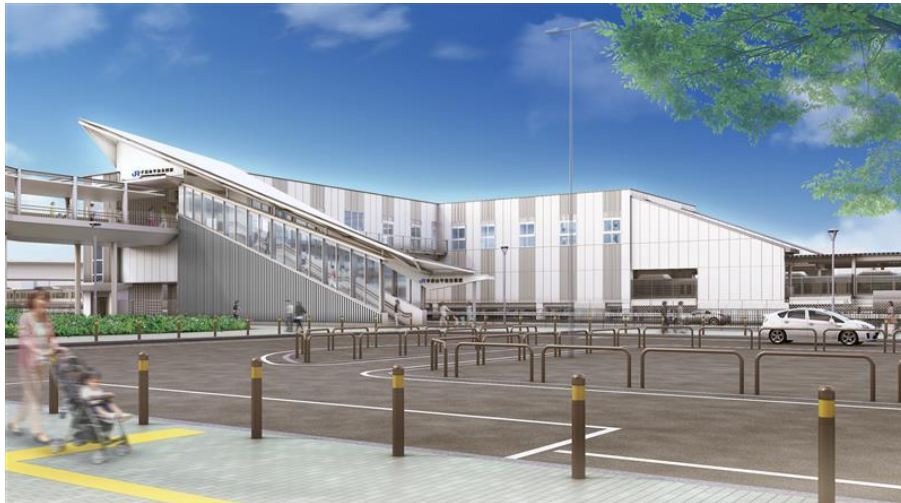
手柄山平和公園駅 南側イメージ

山陽線の姫路駅～英賀保駅間に「手柄山平和公園（てがらやまへいわこうえん）駅」が開業します。新快速、快速、普通列車に加え、通勤特急「らくラクはりま」が停車します。快適・便利に通勤いただける有料座席サービスも合わせてご利用ください。