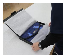
障がいを持つ社員による 梱包・発送作業