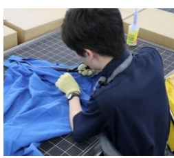
障がいを持つ社員による 仕分け・裁断作業