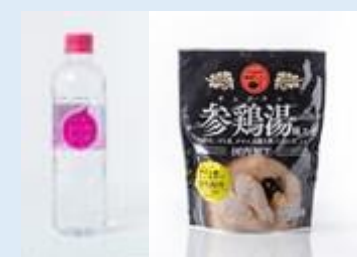
天然水「シリカシリカ」 わかめ韓国キッチ 参鶏湯風スープ