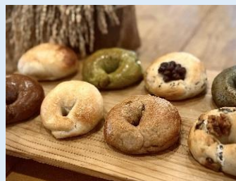
米粉のベーグル各種