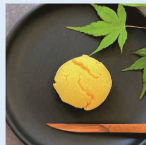
関門海峡にのぼる月