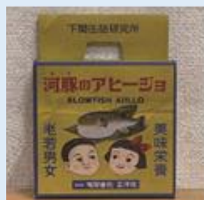
河豚のアヒージョ