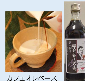
カフェオレベース