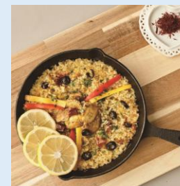
天然フグの下関パエリアの素