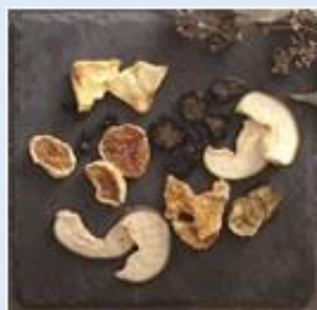
無添加無砂糖ドライフルーツ