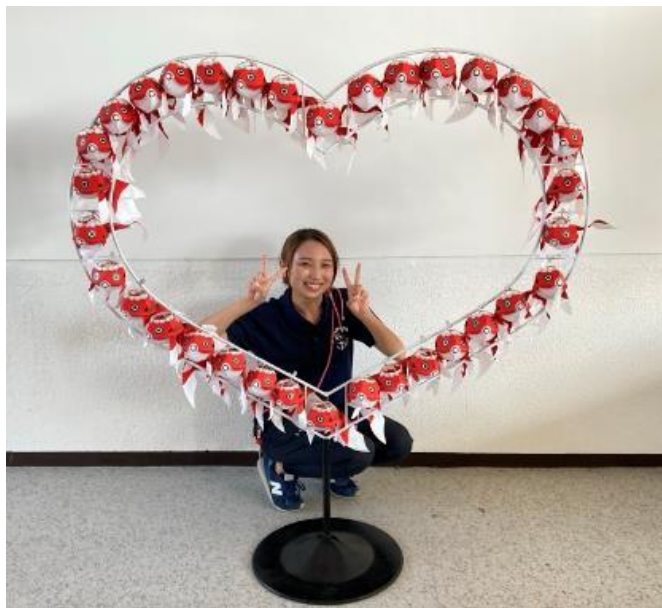
金魚ちょうちんハート型フレーム装飾