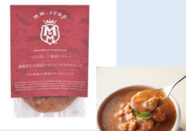
潮風育ちの壺田トマトと トラフグのスープ