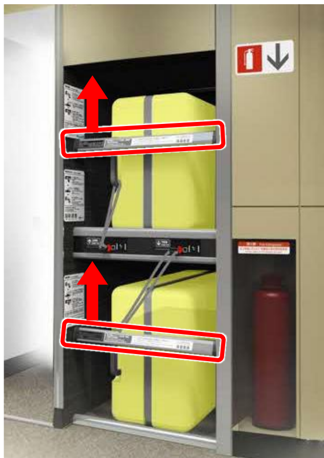
デッキ部の荷物置場 (現「特大荷物コーナー」)

荷物の転落を防止するためのバーが設置されています。 そのまま持ち上げて荷物を収納してください。