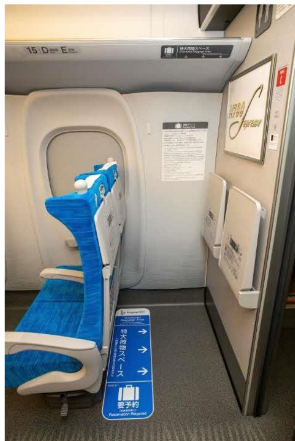
(特大荷物スペース)