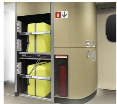
デッキ部の荷物置場 （現「特大荷物コーナー」）

※お客様同士でゆずりあって、ご利用ください。空きスペースがない場合は、従来どおり、荷物棚等をご利用ください。