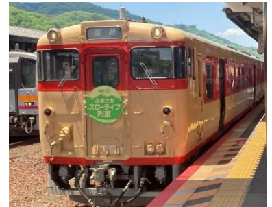
みまさかスローライフ列車