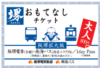
▲堺おもてなしチケット（阪堺拡大版）