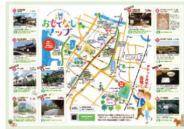
▲堺おもてなしマップ（特典施設掲載）