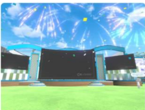
ユーザーによる盛り上げ (例：花火の打ち上げ)