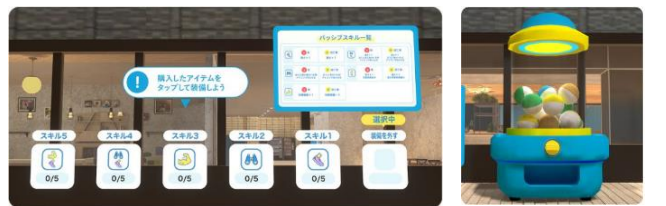
スキルを装備して、よりゲームを楽しめる