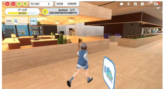
鬼役、逃走者役になってユーザー同士で対戦可能