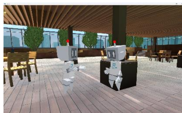
イベントが無い日は憩いの場に (テラススペース)