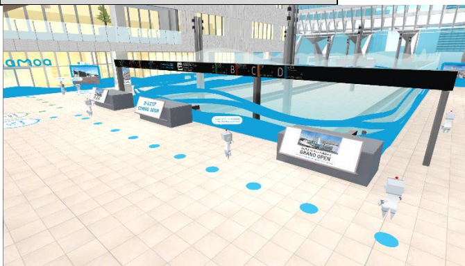
ミナモアの象徴的空間「中央アトリウム」を拡張・再現