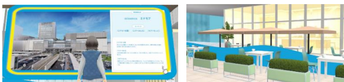
バーチャル上の情報発信の場・集いの場に