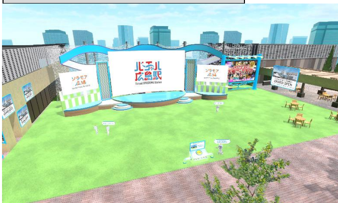
ソラモア広場を拡張・再現した“バーチャルイベントスペース”