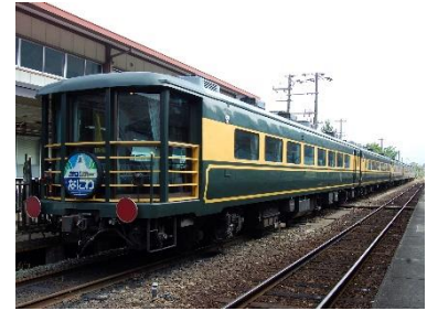
▲「サロンカーなにわ」

※営業路線を運転して搬入するため、輸送上の都合により展示を中止する場合があります。