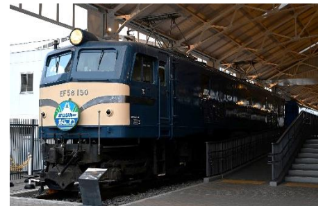
▲EF58形150号機 サロンカーなにわヘッドマーク(複製)