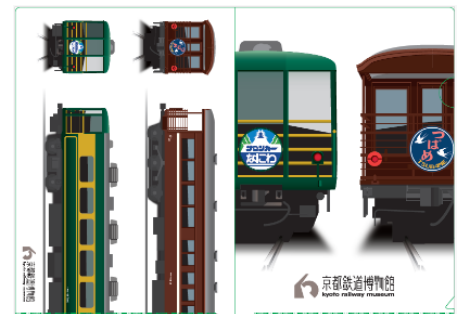
▲A4クリアファイル(裏表)

「サロンカーなにわ」特別展示期間中、株式会社日本旅行の協力により同社が所有する「サロンカーなにわ」ヘッドマーク(複製)を当館収蔵のEF58形電気機関車150号機に掲出します。