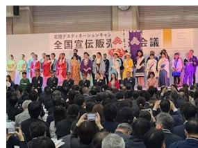
全国宣伝販売促進会議

北陸DC本番1年前に全国主要旅行会社、マスコミ関係者を招き、 北陸三県の観光素材をPR(会議参加者 762 名)