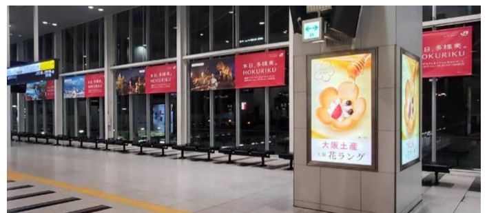
J R大阪駅での装飾 (3階南北連絡橋)