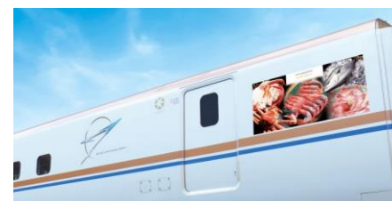
北陸デザインラッピング新幹線

北陸三県の名所や食などをデザインした北陸新幹線を敦賀～東京間で運行し、北陸旅の魅力を発信