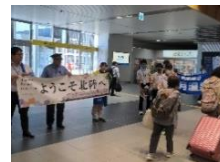
黒部宇奈月温泉駅