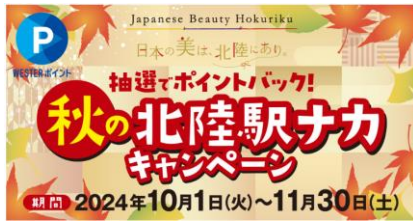
北陸駅ナカポイントバックキャンペーン