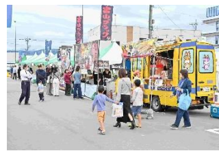
北陸DCオープニングイベントの様子