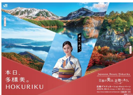
ポスタービジュアル