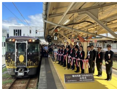
敦賀駅での出発式