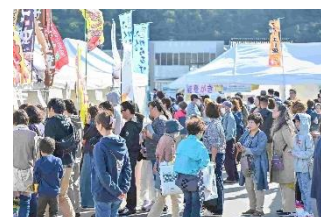
北陸グルメイベントの様子