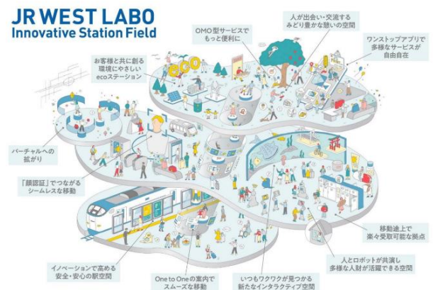
JR WEST LABO