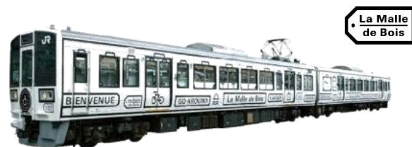
ラ・マル・ド・ボア（写真はイメージです）