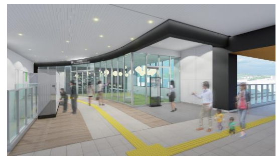
【高屋情報ラウンジ外観イメージ】