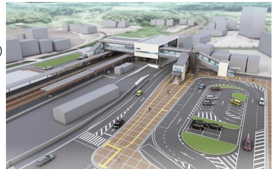
【全体完成イメージ】