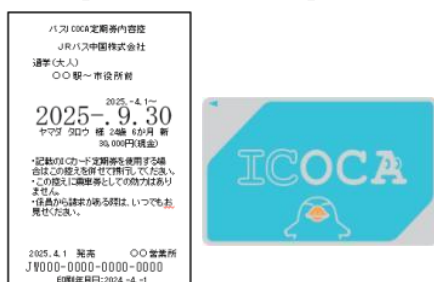
<バスICOCA定期券内容控>