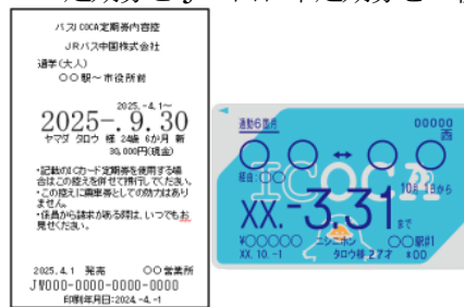
<バスICOCA定期券内容控>