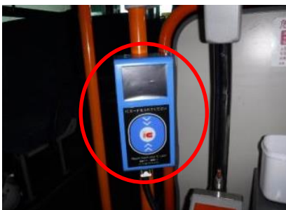
<乗車時のICカードリーダー>