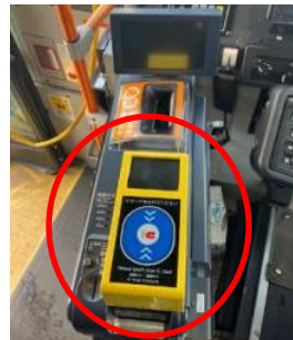
<降車時のICカードリーダー>