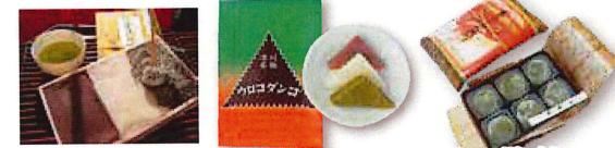
三色だんご 新潟県・新潟駅 ウロコだんご 北海道・深川駅 すずらん餅(丸政) 山梨県・小淵沢駅