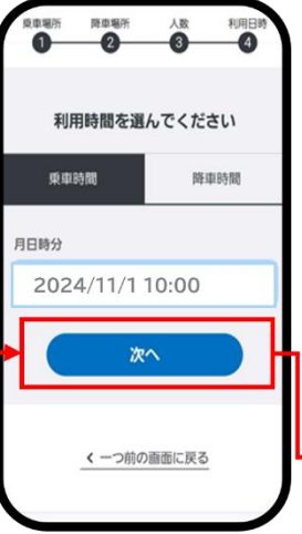
乗車日、利用時間を入力