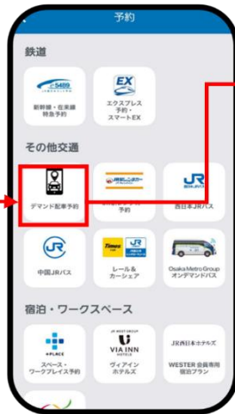
「デマンド配車予約」を押す