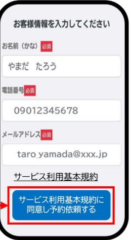
名前(かな)、電話番号、メールアドレスを入力し「サービス利用基本規約に同意し予約依頼する」を押す