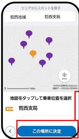
乗車場所、降車場所を選択する。