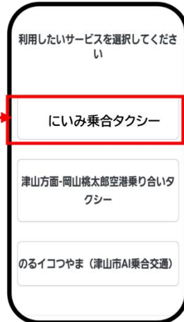
「にいま乗合タクシー」を選ぶ。次画面以降で予約操作をします。