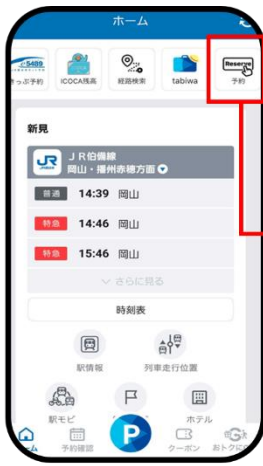
「WESTER」のホーム画面「予約」を押す