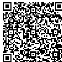
▲tabiwa by WESTER

今回ご案内の取り組みは、SDGsの17のゴールのうち、特に11番に貢献するものと考えています。