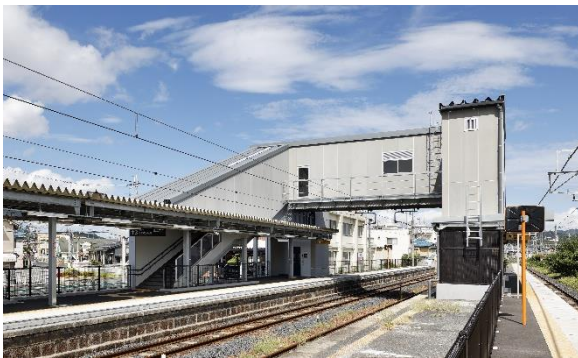
【エレベーター付きこ線橋】