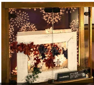
【スーパーアグリーン車 飾り棚】