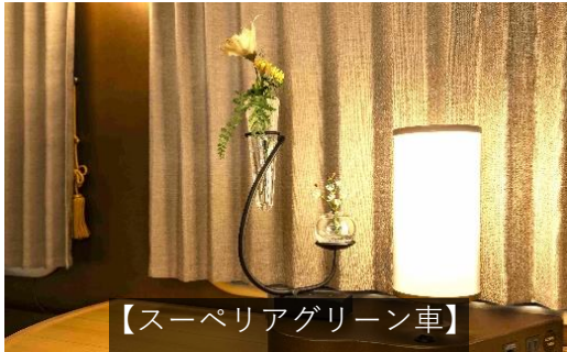
【スーパーアグリーン車】