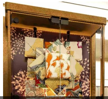
【スーパーアグリーン車 飾り棚】