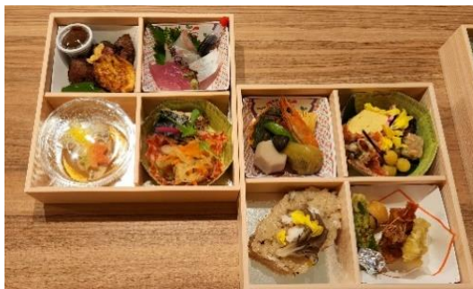
若狭高浜「別邸たち太」

※写真はイメージです（季節により内容が異なる場合がございます） ※お刺身の提供はございません。焼き魚等をご用意しております。