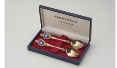
▲「新幹線岡山開業記念スプーン」 1972(昭和47)年

山陽新幹線は、1975(昭和50)年3月10日に博多まで延伸され、新大阪—博多間が開通しました。山陽新幹線全通までのドラマをゆかりの資料で紹介します。