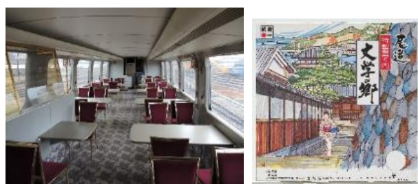
▲(左)100系新幹線食堂車(再現展示イメージ) (右)【駅弁掛け紙】尾道 特製幕の内 文学の郷 尾道駅・新尾道駅 1991(平成3)年