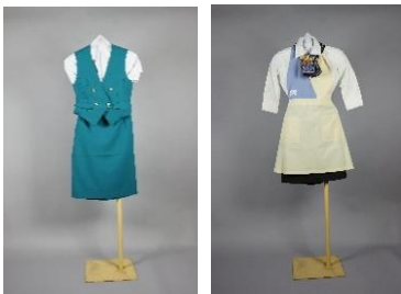
▲(左)新幹線女子サービス係制服 (食堂・車販)初代複製 2000(平成12)年 (右)新幹線車内販売員制服 2代目 2008(平成20)年頃