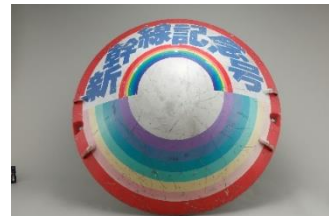
▲0系新幹線電車前頭部カバー 「新幹線記念号」新幹線15周年記念 1979(昭和54)年