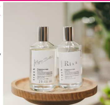
「フレグランスミスト」※イメージ