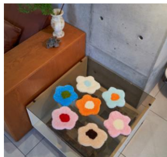
「オリジナルミニラグ」※イメージ