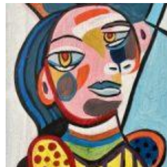
「ピカソのスタイルで自画像」 ※作画イメージ