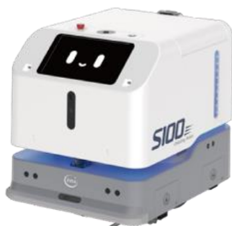
使用するロボット