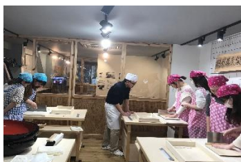
越前蕎麦倶楽部でのそば打ち体験