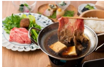
能登牛のすき焼き御膳