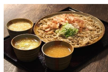
福井県産そば食べ歩きクーポン 「あみたそば服の井店」