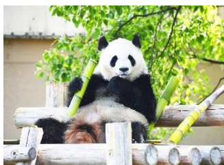
彩浜（撮影日：2023年11月16日）

※時季により休園日・営業時間が変更となる場合があります。事前に施設ホームページにてご確認ください。