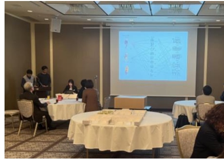
プレゼンテーションの様子(左:大阪工業大学、右:京都芸術大学(第1班))