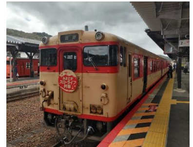
みまさかスローライフ列車