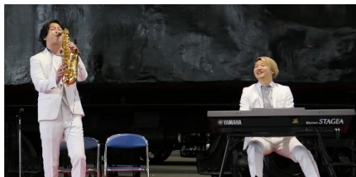
▲過去に開催した様子