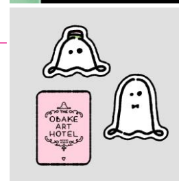
OBAKE ART HOTEL オリジナルステッカー