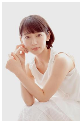
吉岡里帆【ゲスト女優】

1992年、大阪府出身。2021年、乃木坂46を卒業。ドラマ「推しが武道館いってくれたら死ぬ」(2022)、「ショジョ恋。」(2023)、「劇場版 推しが武道館いってくれたら死ぬ」2023など。