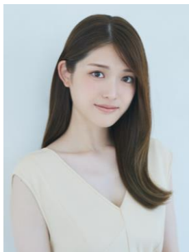
松村沙友理【ゲストモデル】

1992年、大阪府出身。2021年、乃木坂46を卒業。ドラマ「推しが武道館いってくれたら死ぬ」(2022)、「ショジョ恋。」(2023)、「劇場版 推しが武道館いってくれたら死ぬ」2023など。