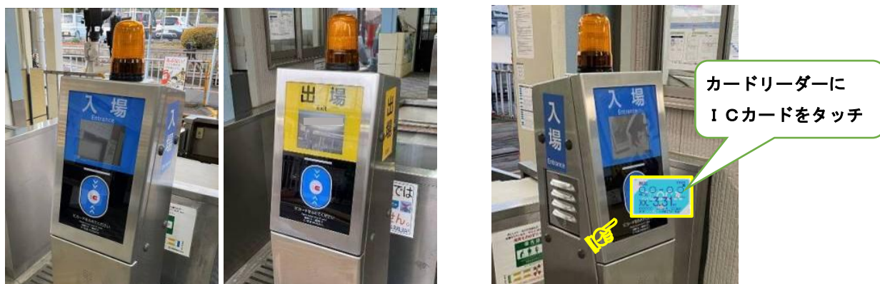
IC改札機(青:入場用、黄:出場用)