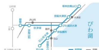
▲京阪電車大津線1日乗車券(ご利用可能エリア)

京阪電車 大津線（石山寺～坂本比叡山口・御陵～びわ湖浜大津）が1日乗り放題です。