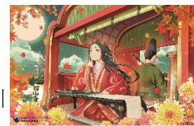
▲紫式部 大津周遊チケット

※利用当日、事前に以下の引換場所でアプリのチケット引き換え用画面を提示の上、お引き換えください。チケットご利用時に入力するパスコードは、京阪電車の係員にお尋ねください。