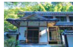
▲大河ドラマ館(明王院)

1月29日に石山寺境内の明王院にオープンする「光る君へ びわ湖大津 大河ドラマ館」と世尊院にオープンする「恋」をテーマに平安時代の文化を楽しむことができる「源氏物語 恋するもののあはれ展」の入館引換券です。