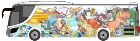
XR バスラッピングイメージ（左面）