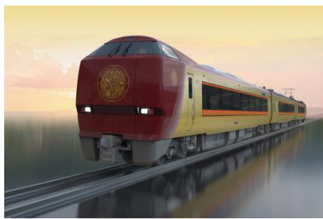
683系リニューアル 第一編成「安寧」

※4月以降にデビューするリニューアル車両の情報については、以下のプレスリリースもご確認ください。