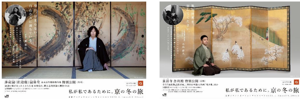
JRグループの主な駅・車内で展開するポスターの一例 ※画像はイメージです

<京都デスティネーションキャンペーン「第58回京の冬の旅」JRグループポスター>