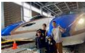
先頭車両で写真撮影