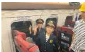
制服を着て写真撮影