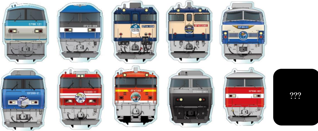
▲JR 貨物 トレーディング アクリルマグネット 750 円(税込) ※全 11 種のうち 1 個入り (BOX 購入で全 11 種類コンプリート可能)