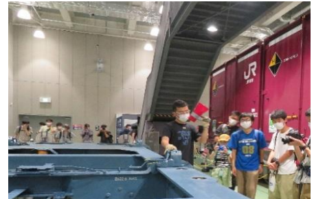
▲過去に開催した様子