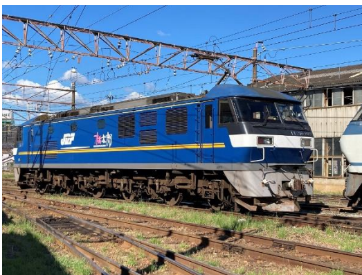
▲EF210形式309号機直流電気機関車

展示期間中は、通常は間近で見ることが出来ない車両を様々な角度からご覧いただけます。また、関連イベントも開催しますので、ぜひこの機会にお越し下さい。