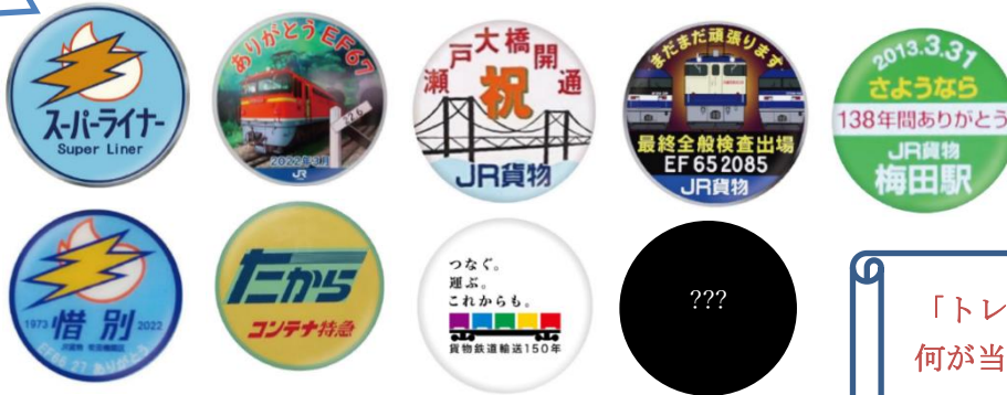
▲JR 貨物 ヘッドマーク トレーディング 缶バッジ 400 円(税込) ※全 9 種のうち 1 個入り (BOX 購入で全 9 種類コンプリート可能)