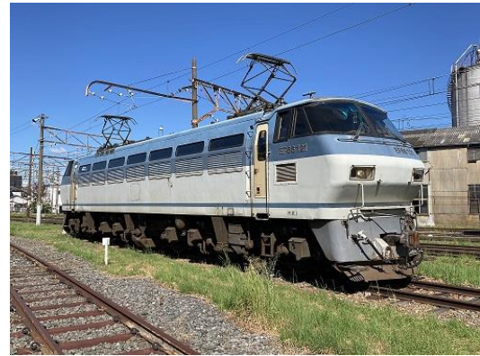
▲EF66形式121号機直流電気機関車