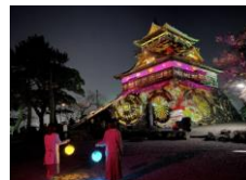
丸岡城プロジェクトマッピングナイト「ヒカリ結び」