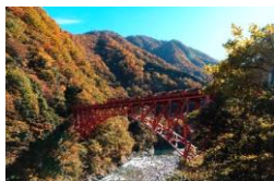
黒部峡谷トロッコ電車(新山彦橋)