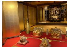
加賀伝統工芸村 ゆのくにの森「黄金の間」