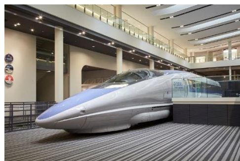
▲500系新幹線電車 521形1号車